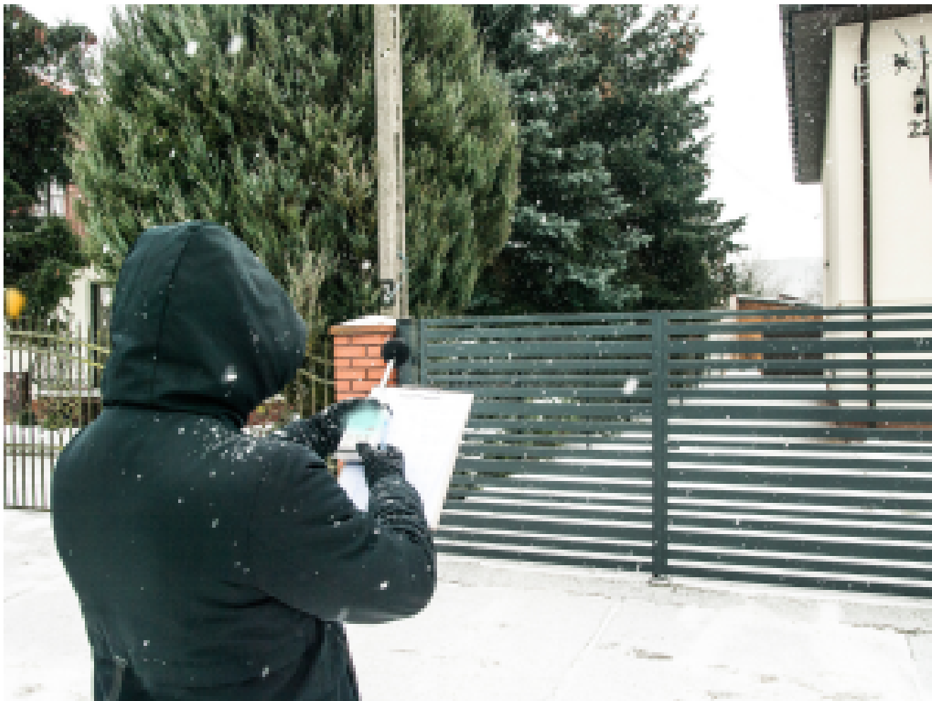
Pomiar hałasu prowadzony na ulicy Sokołowskiej.