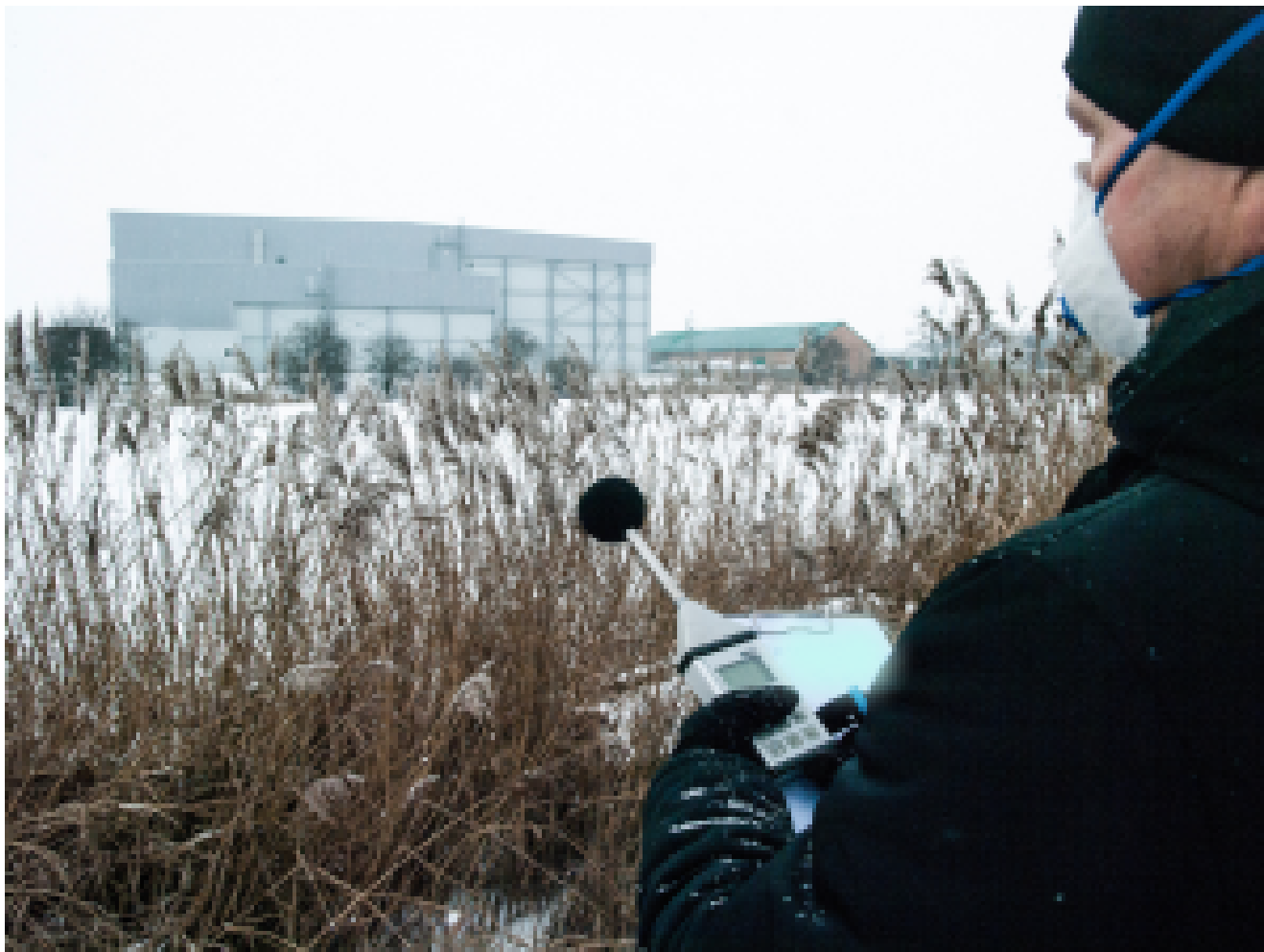
Pomiar hałasu w okolicy hali magazynowej